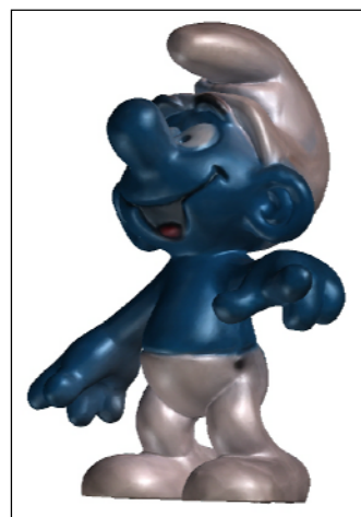
Application de la peau colorée

La couleur et la texture sont mémorisés et exportables sous différents formats afin de les intégrer aisément dans des modules de visualisation et de présentation.