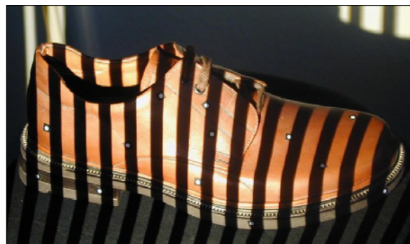
Numérisation d'une chaussure

Une série de clichés photographiques, qui permet de « couvrir » l'ensemble de l'objet, est ensuite prise. Le logiciel TRITOP, interprète ces clichés et les recalent dans le même référentiel que celui utilisé pour la numérisation. Le nuage de points est importé dans TRITOP, qui applique à sa surface les couleurs issues des photographies.